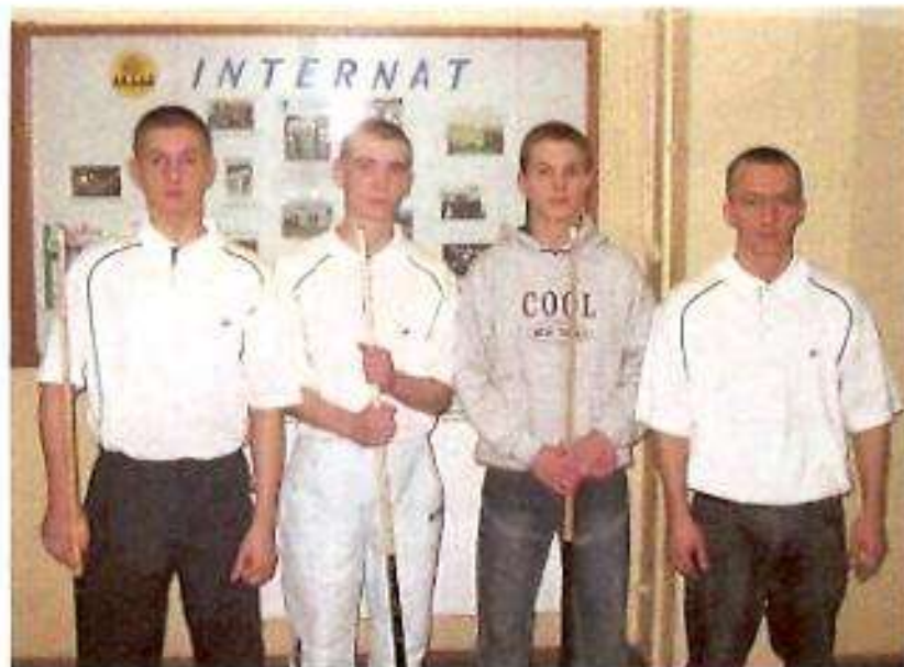
Reprezentanci UKS Moasek